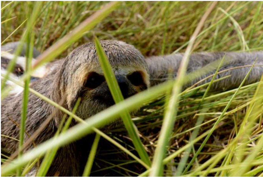
A agonia da preguiça fugindo da destruição da floresta

uso indiscriminado do fogo provocam sérios prejuízos à fauna e flora, reduz a cobertura vegetal, diminuiu a fertilidade do solo e compromete a qualidade do ar. A saúde da população é afetada, principalmente por doenças respiratórias.