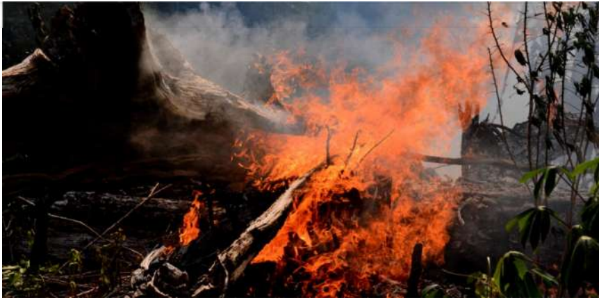
Floresta incendiada no entorno da BR 319, em Autazes