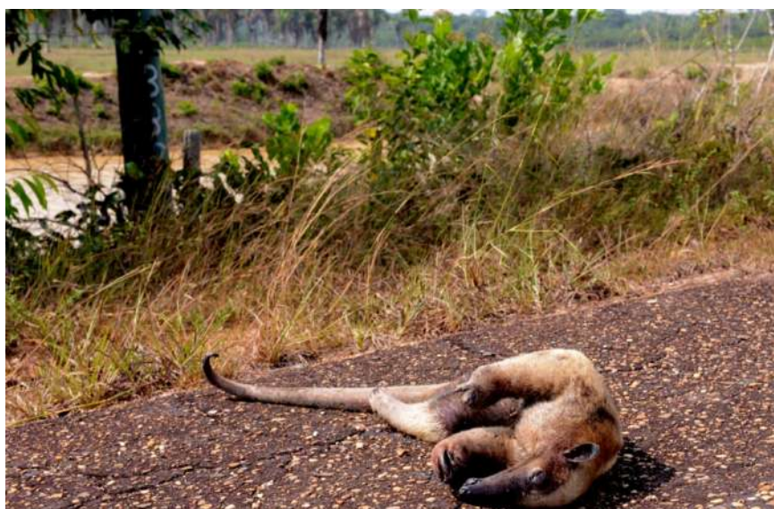
O tamanduá morreu na estrada após fugir das queimadas.

pousada no Lago do Mamori, no município de Careiro, a 24 quilômetros de Manaus, região de influência da BR 319. Ele diz que a natureza na região é “encantadora”, mas este ano as queimadas no entorno estão gravíssimas.