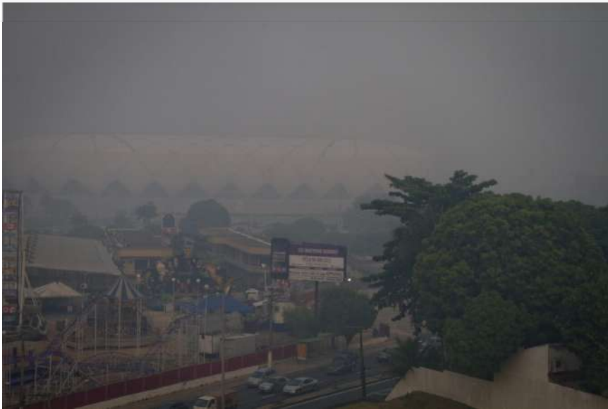
A Arena da Amazônia encoberta pela fumaça em Manaus

Nesta quinta-feira (1º. de outubro) Manaus, com cerca de 2 milhões de habitantes, amanheceu sob uma forte névoa por consequência das queimadas e incêndios florestais, o que compromete a qualidade do ar. Esta mesma situação já aconteceu nos anos de 2014 , 2010 e 2009, quando foram registradas secas grandes nos rios Negro e Solimões.