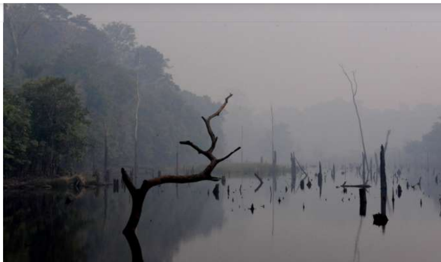
Floresta no entorno da BR 319