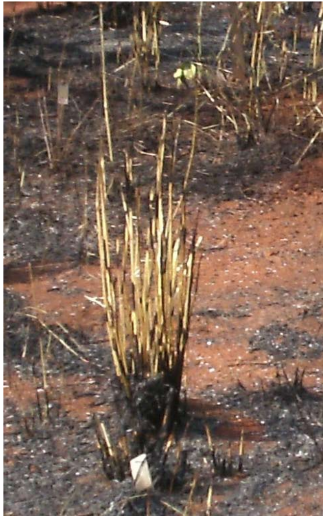
Figura 2 – Indivíduo de Andropogon gayanus em área de Cerrado Ralo, após queimada controlada, realizada em setembro de 2009, em área de Cerrado Ralo invadida por Andropogon gayanus no Parque Nacional de Brasília-DF.

Figure 2 – Andropogon gayanus individual in a Cerrado Ralo area, after a prescribed burning in September 2009 in Parque Nacional de Brasília, Brasília, DF.