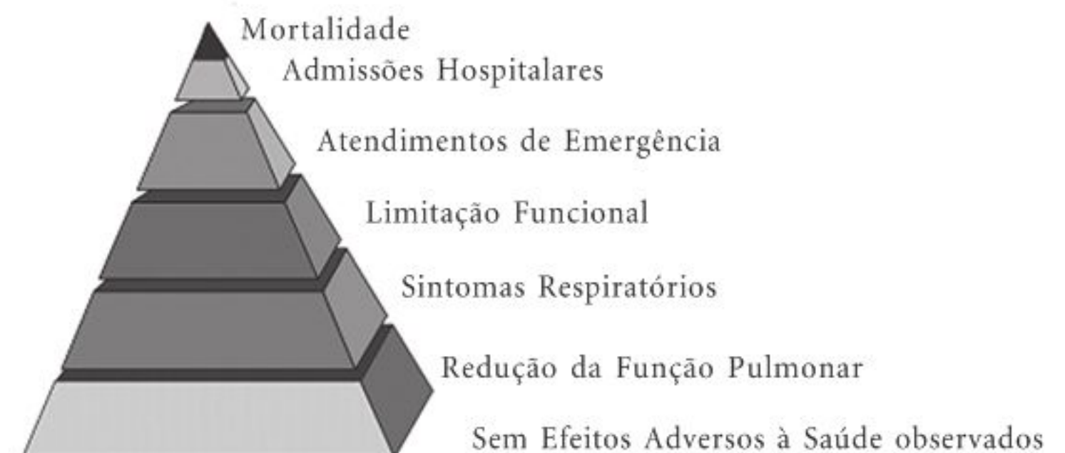
Figura 1. Pirâmide dos Efeitos à Saúde.

A vulnerabilidade biológica de crianças e idosos em relação à poluição atmosférica decorre de peculiaridades fisiológicas. Na criança, fatores como maior velocidade de crescimento, maior área de perda de calor por unidade de peso, elevadas taxas de metabolismo em repouso e consumo de oxigênio, possibilitam que os agentes químicos presentes na atmosfera acessem suas vias respiratórias de forma mais rápida em comparação aos adultos. Nos idosos, fatores relacionados à baixa imunidade e à redução da função