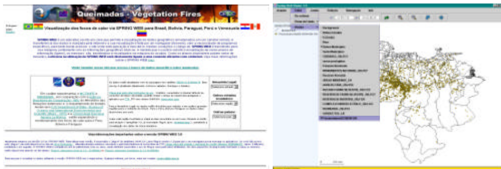
Figura 2: Apresentação dos resultados (SpringWeb)

A visualização dos dados é feita de forma simple e interativa, possibilitando assim o acesso a qualquer tipo de usuário. (Figura 2).