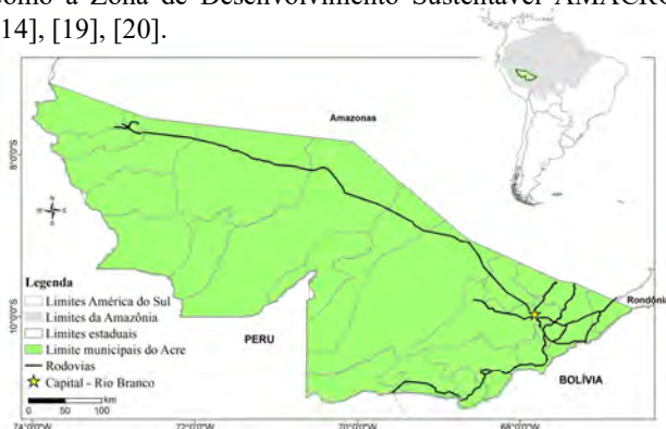
Figura 1. Área de estudo, Estado do Acre-Brasil.

O estudo foi realizado no Estado do Acre, localizado na região Sul-Occidental da Amazônia Brasileira (Figura 1). O estado possui uma área total de 16.412.410 ha e uma área desmatada até 2021 de 2.477.988 ha (representando cerca de 15%) [17], [18]. O Acre passa por um momento de forte expansão de sua fronteira agrícola por conta de políticas estaduais e federais de desenvolvimento econômico agrícola, como a Zona de Desenvolvimento Sustentável AMACRO [14], [19], [20].