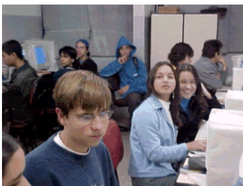
Figura 1 – Turma Geodem em aula no Laboratório de Informática da Escola

A aplicação da metodologia adotada, ocorreu em quatro turmas de duas escolas públicas, com um total de 122 alunos, ao longo de um semestre letivo. A aplicação ocorreu após a capacitação dos professores de geografia envolvidos na pesquisa. Esta capacitação consistiu em familiarizar os professores no acesso e uso do GEODEM, bem como das tecnologias envolvidas no sistema. Foram ministrados os conteúdos às turmas participantes conforme cronograma seguido pelas Turmas Geodem (turmas que utilizaram o GEODEM, Figura 1 ) e Tradicionais (sistema de ensino tradicional, sem o uso da informática). As atividades se desenvolveram durante os horários normais das aulas de geografia nas escolas.